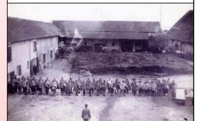
Sous les ordres d'un militaire français, prisonniers allemands employés à la ferme de la Conge

En Juin 1917, l'aérodrome de Trilbardou-Chauconin accueille l'Escadrille AR 233. Le cantonnement des troupes s'effectue à la ferme de la Conge, à Trilbardou