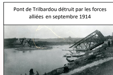
Pont de Trilbardou détruit par les forces alliées en septembre 1914

3 ème brigade de cavalerie anglaise contrôle les ponts d'Esbly et de Trilbardou. Le commandant anglais, Sir John French, donne les points de traversée de la Marne et les consignes de destruction des ponts. Celui de Trilbardou sera détruit le 3 Septembre.