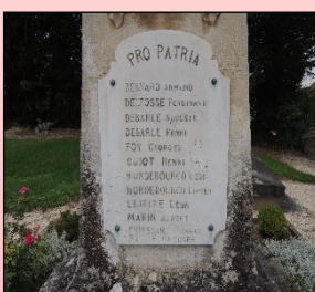
Monument aux morts du cimetière de Trilbardou

1918 : Les dernières troupes du 1er régiment de tirailleurs marocains quitteront Vignely en Décembre 1918.