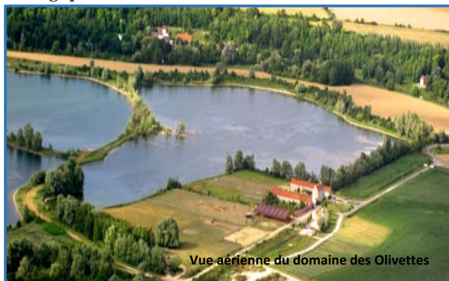
Vue aérienne du domaine des Olivettes

Depuis, il ne cesse de valoriser ses terres en diversifiant ses activités, tout en préservant ce site exceptionnel tant par sa beauté que par sa valeur écologique.