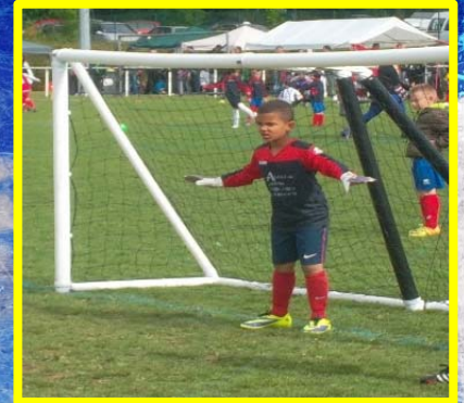
Claye-Souilly Sportif Football Stade Clément Petit, 40 av Pasteur Tel 01 60 26 03 39

Il est d'ailleurs abonné sur la toile au Club PSG Junior ce qui lui permet d'assister à des matchs à des tarifs préférentiels au Parc des Princes mais aussi de pouvoir jouer au football avant les matchs et à la mi-temps dans l'espace réservé aux abonnés.