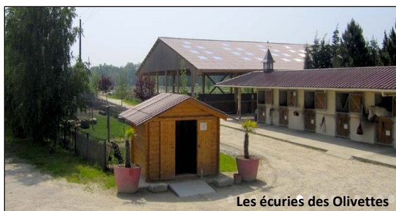
Les écuries des Olivettes

Derrière la ferme, Christophe a construit des écuries d'une capacité de 32 chevaux. Chaque cheval a un box et un paddock privés. Un manège couvert et un club house sont à la disposition des propriétaires de chevaux. Les écuries occupent 3 personnes à plein temps.