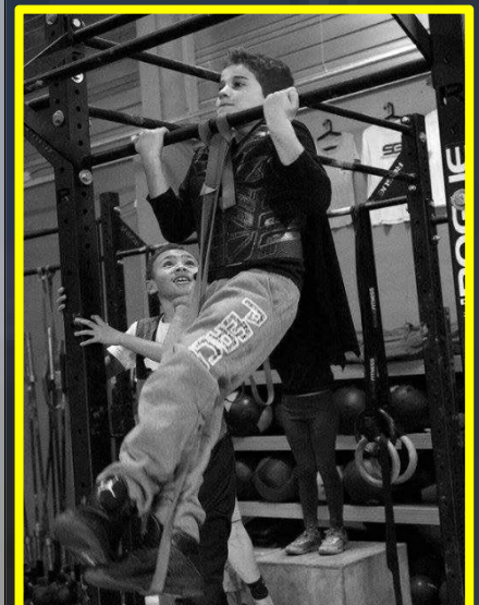
Qu'est-ce qui te plaît dans cette activité ? J'aime beaucoup faire des sauts de box en box et grimper. On court aussi en extérieur. J'aime faire des pompes, et des séries d'ahabs.